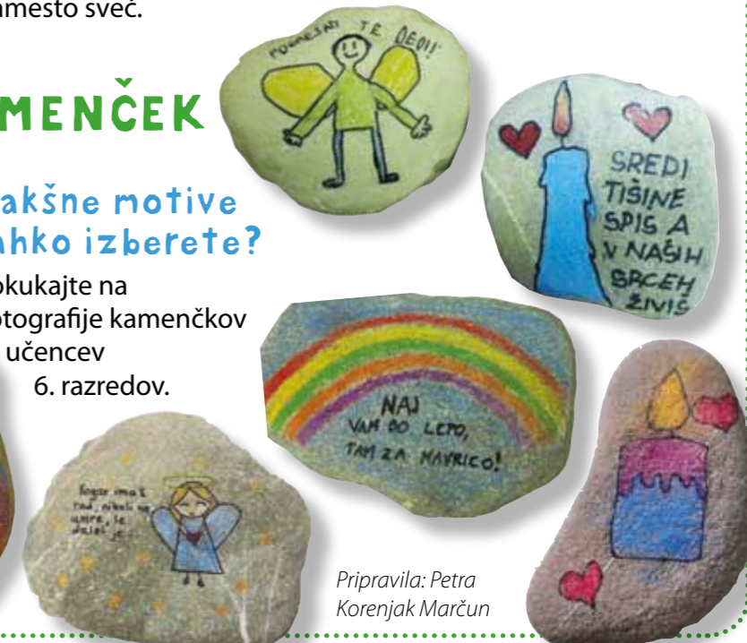
Pripravila: Petra Korenjak Marčun

Pokukajte na fotografije kamenčkov učencev 6. razredov.